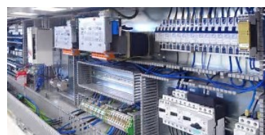
Figura 1. Estructura del Máster en Diseño e Ingeniería de Productos e Instalaciones Industriales.

MÁSTER OFICIAL EN INGENIERÍA Y DISEÑO INDUSTRIAL con BIM y PLM