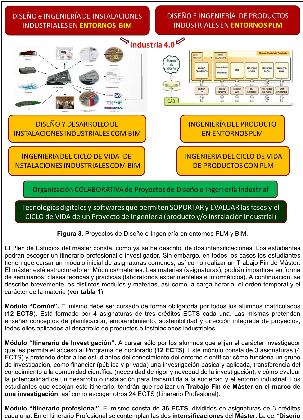
Figura 3. Proyectos de Diseño e Ingeniería en entornos PLM y BIM.

El Plan de Estudios del máster consta, como ya se ha descrito, de dos intensificaciones. Los estudiantes podrán escoger un itinerario profesional o investigador. Sin embargo, en todos los casos los estudiantes tienen que cursar un módulo inicial de asignaturas comunes, así como realizar un Trabajo Fin de Máster. El máster está estructurado en Módulos/materias. Las materias (asignaturas), podrán impartirse en forma de seminarios, clases teóricas y prácticas (laboratorios experimentales e informáticos). A continuación, se describe brevemente los distintos módulos y materias, así como la carga horaria, el orden temporal y el carácter de la materia (ver tabla 1):