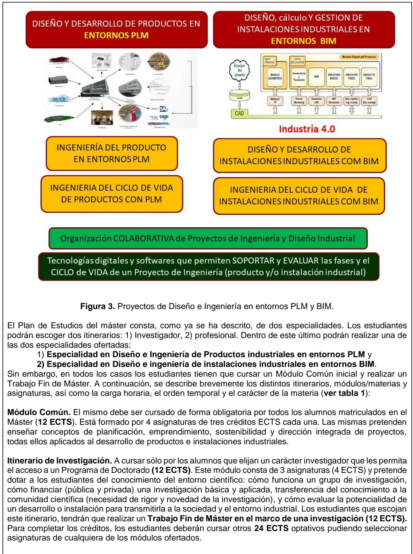
Figura 3. Proyectos de Diseño e Ingeniería en entornos PLM y BIM.

El Plan de Estudios del máster consta, como ya se ha descrito, de dos especialidades. Los estudiantes podrán escoger dos itinerarios: 1) Investigador, 2) profesional. Dentro de este último podrán realizar una de las dos especialidades ofertadas: