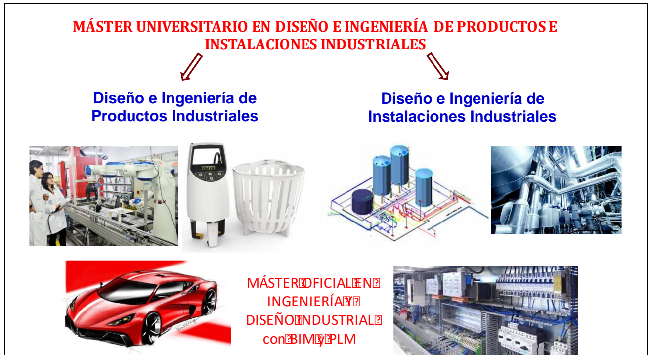
Figura 1. Estructura del Máster en Diseño e Ingeniería de Productos e Instalaciones Industriales.